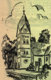
Die alte Kirche in Wersen

Unweit des Großsteingraves finden wir dann auch den Gabelin, eine Anhöhe mit Fernblick auf den Gehn. Heide und Kiefernwald dehnen sich bis zum Horizont. Sieben mächtige Erdwälle, die sogenannten Gabelinschanzen, rufen geschichtliche Erinne-